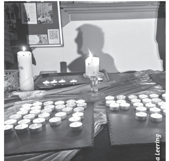
Gedenken an den Beginn des russischen Angriffskriegs – 24. Februar in unserer Kirche