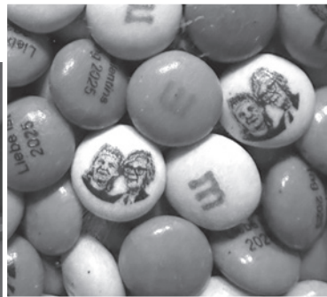
Liebe ist ... ;)