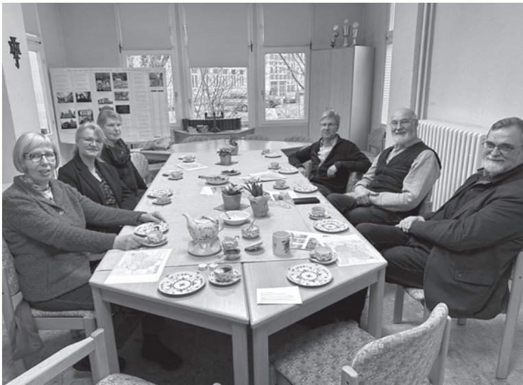
Einlösung der „Ostfriesischen Tee-Zeremonie“ aus unserer letzten Talentversteigerung