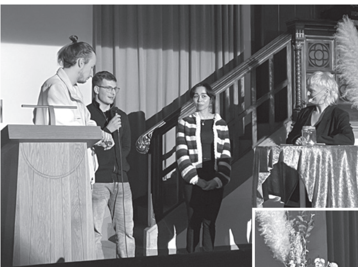
„The holy sh*ts“ mal selbst im Interview des SoulService ...