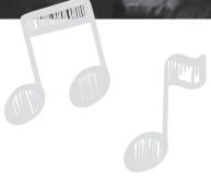
Benefizkonzert des Hamelner Gospelchores „Salt'n'Light“ für unsere Gemeindestiftung. Vielen Dank an die Sängerinnen und Sänger ...