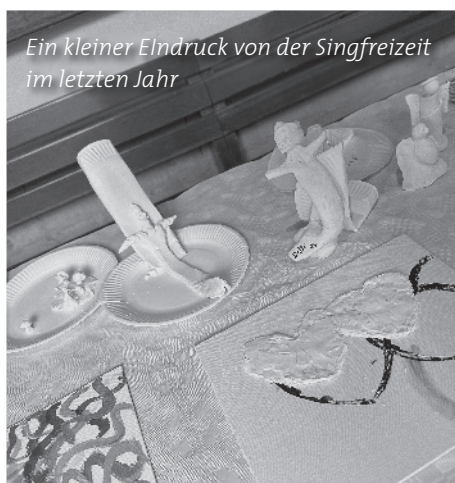
Ein kleiner Eindruck von der Singfreizeit im letzten Jahr