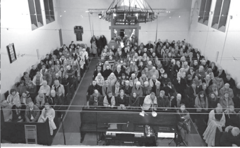
... die Kirche war bis auf den letzten Platz besetzt! Herzlichen Dank für die großartige Kollekte in Höhe von 1.725,27 €!