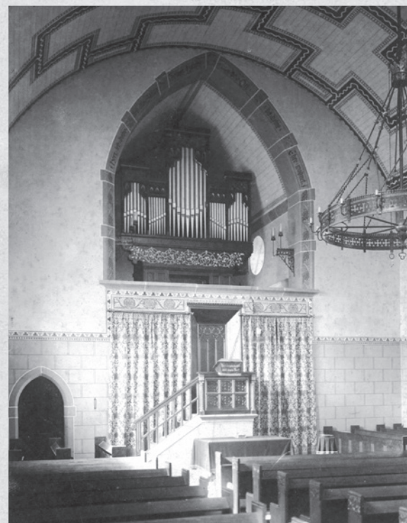
Unsere Kirche 1906