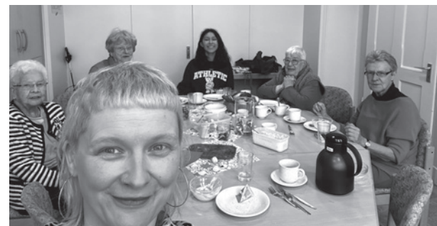
Der letzte Bibelkreis im Dezember ...